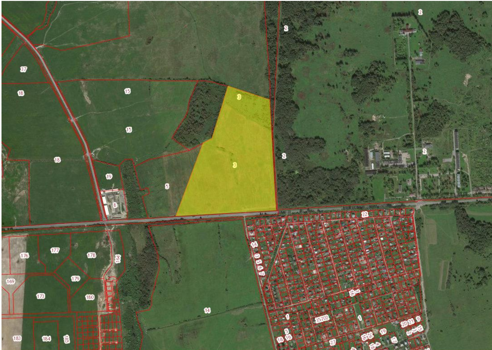
— участок на схеме